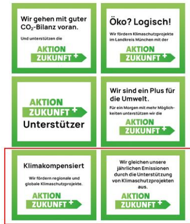
Online-Banner für die Homepage oder Email-Signaturen