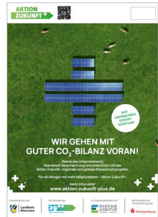
Poster mit Firmenlogo

Kontaktieren Sie uns hierzu gerne direkt unter unternehmen@aktion-zukunft-plus.de .